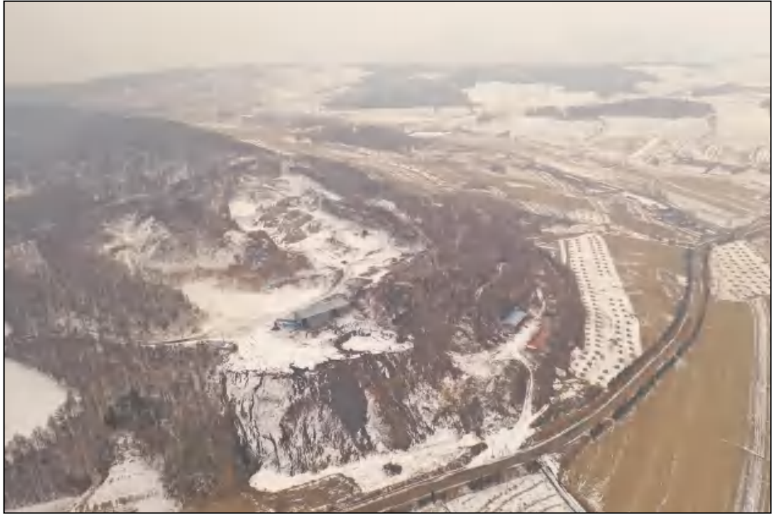
图 2-1 地形地貌图