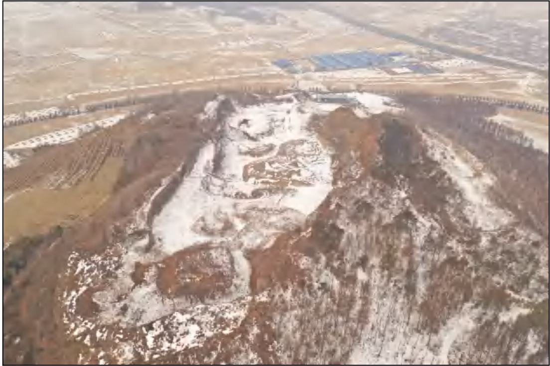
图 1-3 矿山整体布局照片（西向拍照）