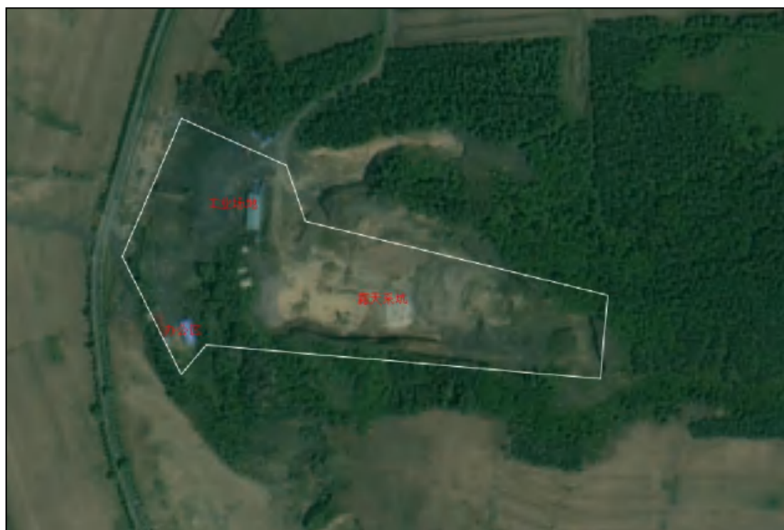
图 1-2 矿山整体布局卫星图

办公区位于矿区的西南侧，面积为 0.1437hm 2 ，主要为 2 处办公用房，均为砖混结构，地上一层建筑物；工业场地位于矿区西侧，面积 2.7490hm 2 ，主要由矿山运输周转场地、料堆场、加工区及已复垦区组成，区内有 5 处构建筑物，分别为加工厂房、值班室及库房，其中加工厂房为钢结构建筑物，其他均为砖混结构，地上一层建筑，已复垦区现状栽植针叶乔木，生长状态良好，占地面积 0.3247hm 2 ；露天采场总面积为 3.6206hm 2 ，最大采深约 24m，现状采坑大部分区域已开采，仅东部及南部区域局部未开采，采坑底最低高程约 434m（采矿许可证底高程 430m），底部为砂层，矿山后期不继续向下开采，采矿边坡部分区域较陡，现状东南侧采矿边坡形成 2 层台阶；大湾村取料区位于矿区北侧，总面积为 1.0626hm 2 ，现状已形成一处采石边坡，边坡高度约 20m，坡底目前用于大湾村堆存白灰等生产资料，坡顶地表破坏，形成一处平台，大湾村取料区原用于大湾村修路期间取料，道路修筑完成后用于白灰、建筑垃圾等临时堆放点。