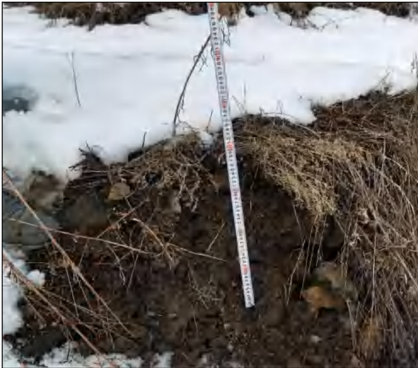
图 2-2 土壤断面图

矿区内表层土壤为暗棕壤，厚度约为 0.3m，土壤的 pH 值 6.2~6.6，为偏酸性土壤，适宜林木生产，土壤有机含量变化在 2.22%~3.58% 之间。