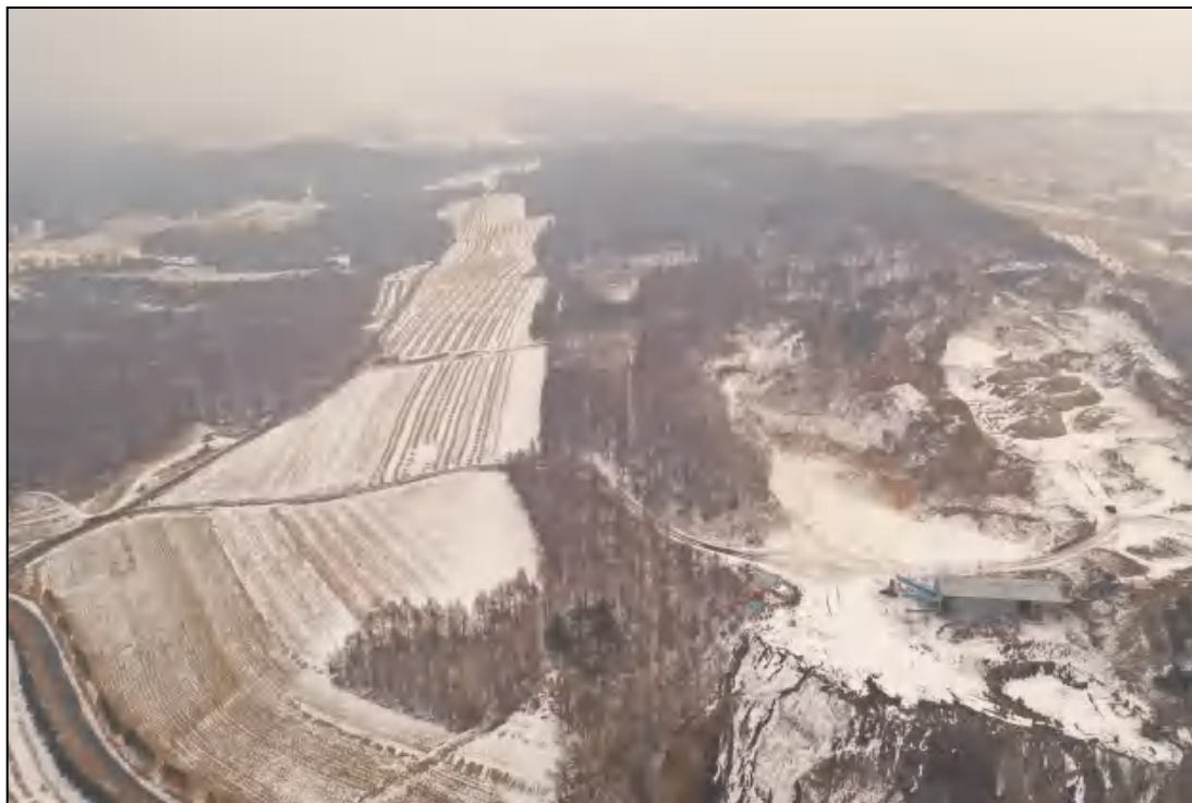
图 2-3 矿区周边植被照片

项目区植被属于长白植物区系，由于开发历史悠久，原始森林已被天然次生林和人工林所替代。现状项目区东侧为以针叶林为主的林地区，矿区外西侧以耕地为主。