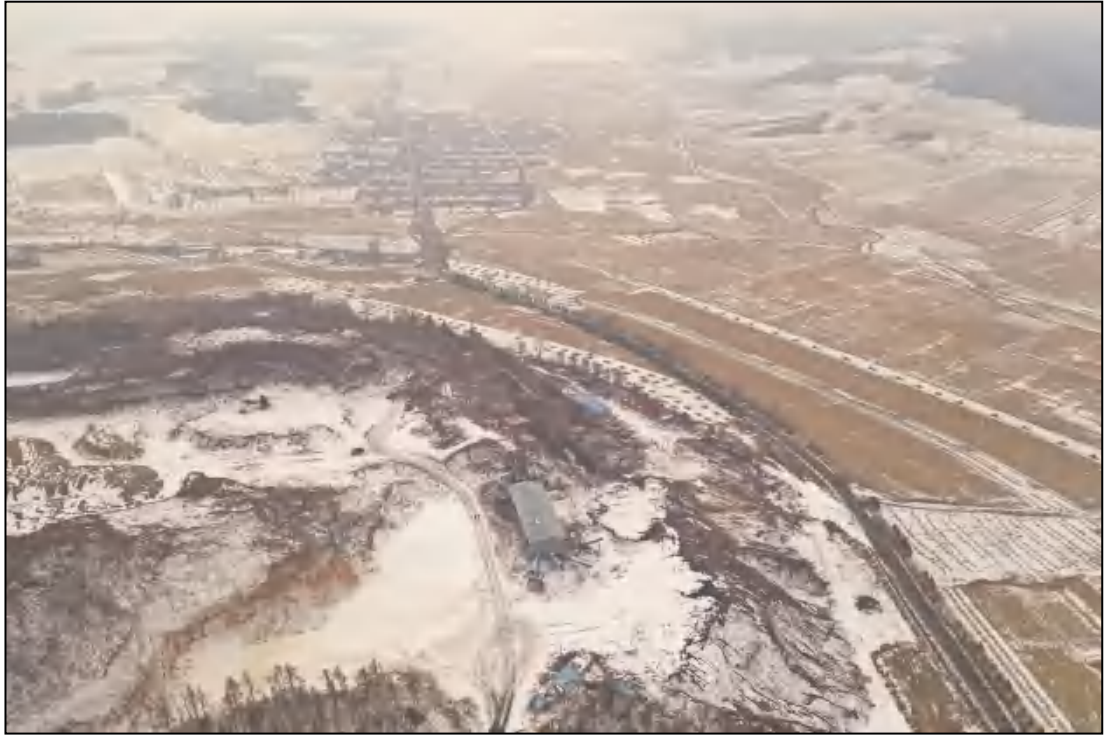
图 1-5 工业场地照片（南向拍照）