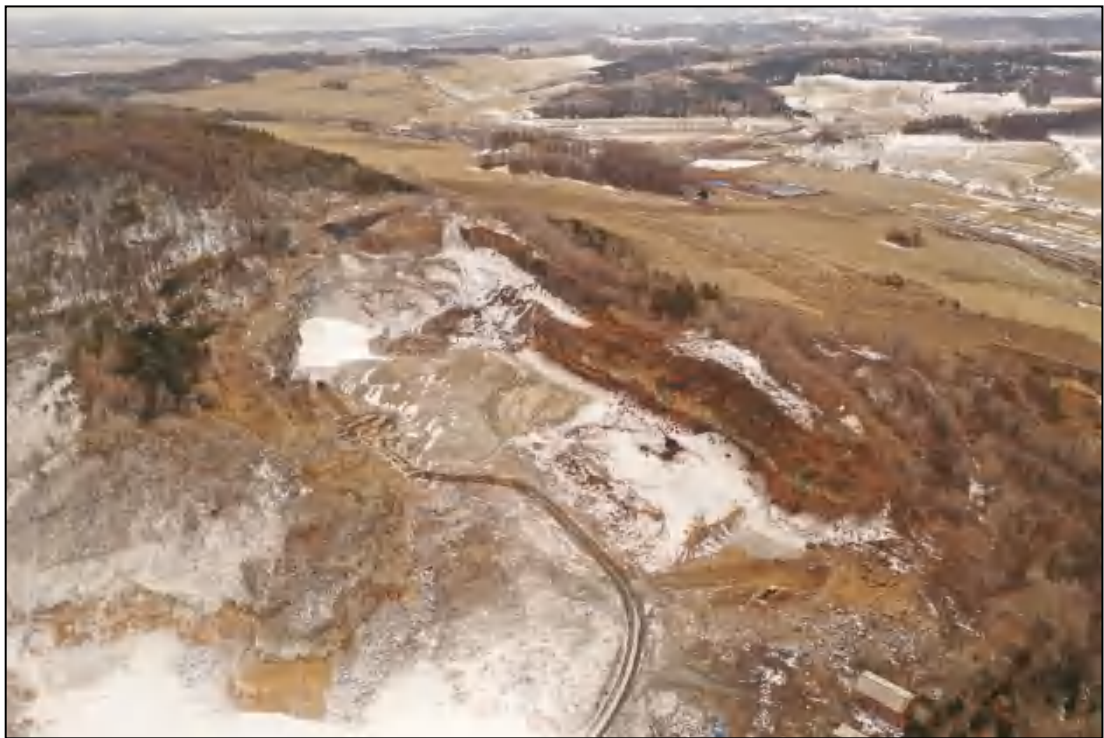
图 1-6 露天采坑照片（东向拍照）