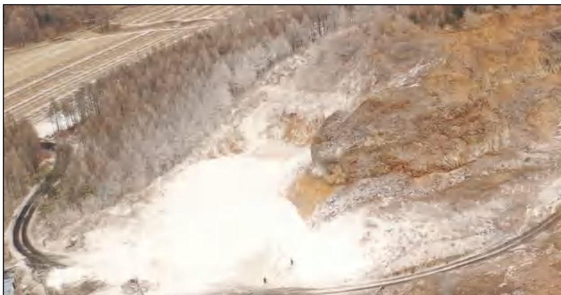
图 1-6 大湾村取料区照片（东向拍照）