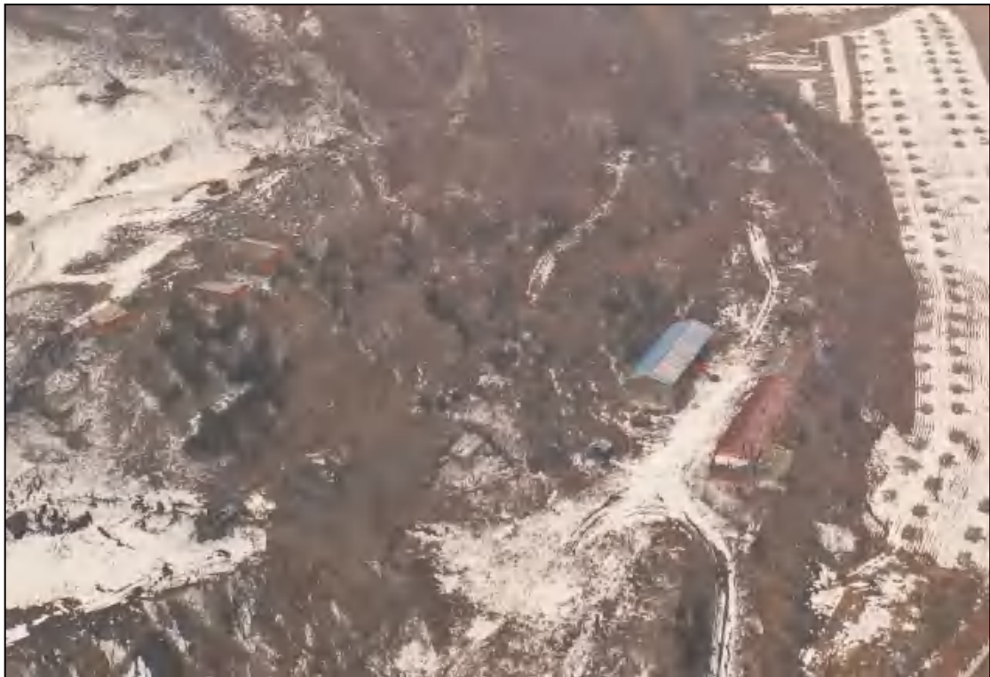
图 1-4 办公区照片（南向拍照）